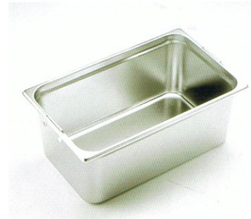
GN-Behälter ohne Griffe