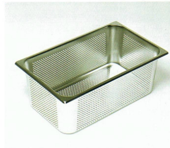
Gelochte GN-Behälter ohne Griffe